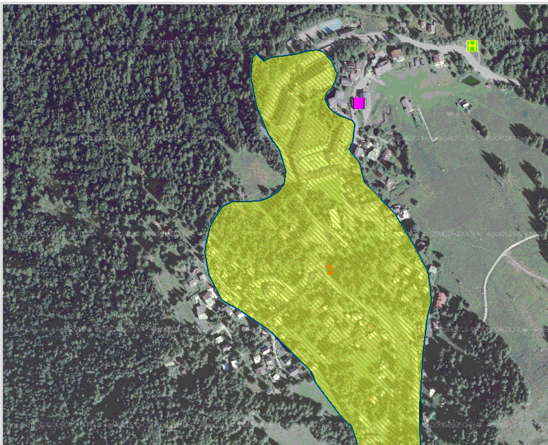
GisMaster-ProtezioneCivile - Estratto della cartografia